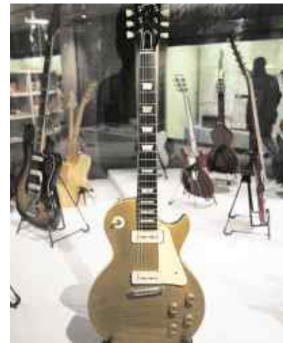
Une « Les Paul » de 1955, exposée en 2006 à la Cité de la musique, à Paris.

À l'aube du 40 e anniversaire de Woodstock, l'inventeur de la guitare qui y fit fureur disparaît. Les Paul, guitariste virtuose américain, est mort jeudi à l'âge de 94 ans. En 1952, il présenta sa trouvaille : une guitare électrique munie d'un « corps plein », qui détrône celles dont la partie centrale était en bois creux. De Pete Townshend (The Who) à Keith Richards (Rolling Stones), en passant par Jimmy Page (Led Zeppelin), des générations de rockeurs l'ont grattée. Et souvent maltraitée, comme Hendrix, faisant flamber la sienne sur la scène de Woodstock.