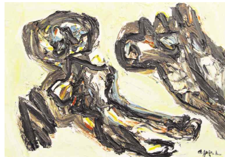
APPEL KAREL (1921-2006) LE MALENTENDU, 1986. HUILE SUR TOILE SIGNÉE EN BAS À DROITE. 65 X 92 CM